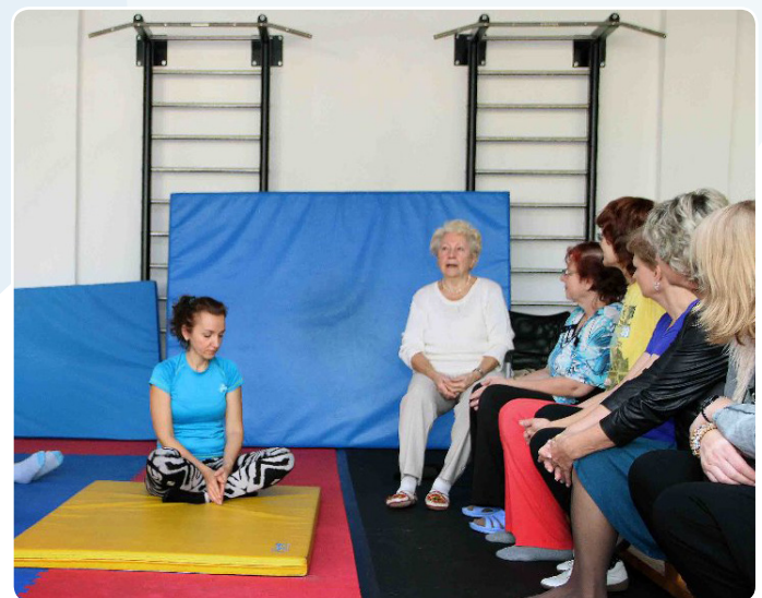
Po celou dobu byla možnost si zacvičit v tělocvičně pod dohledem fyzioterapeutky z FN Plzeň nebo si zaplavat v bazénu.