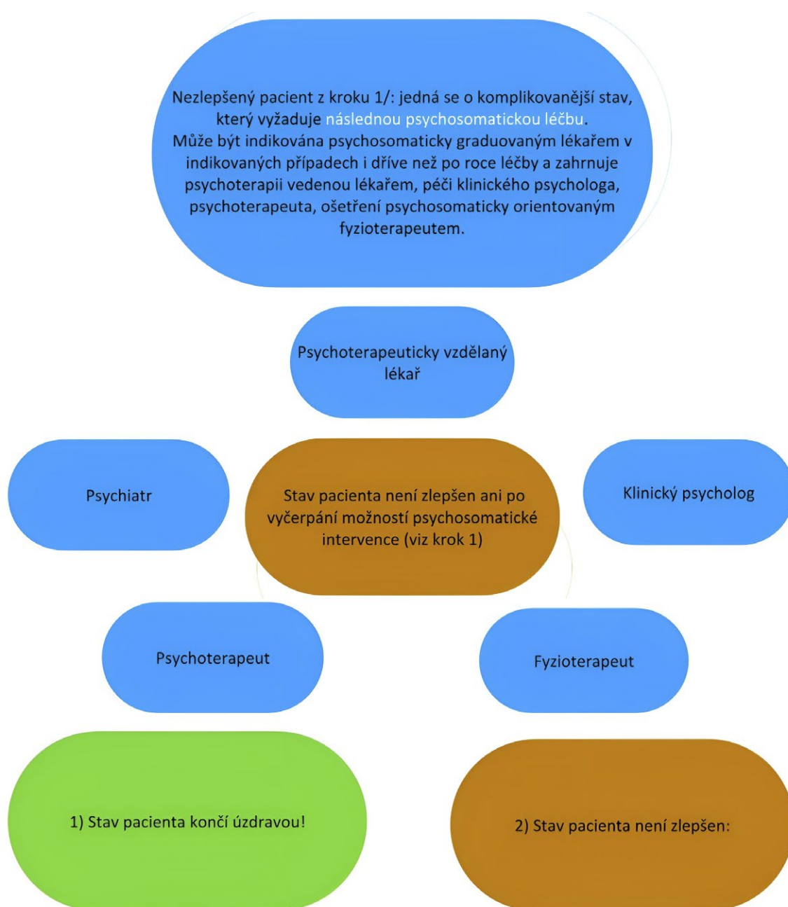
Obr. 2 Schéma managementu pohybu psychosomatického pacienta v systému zdravotní péče – krok 2